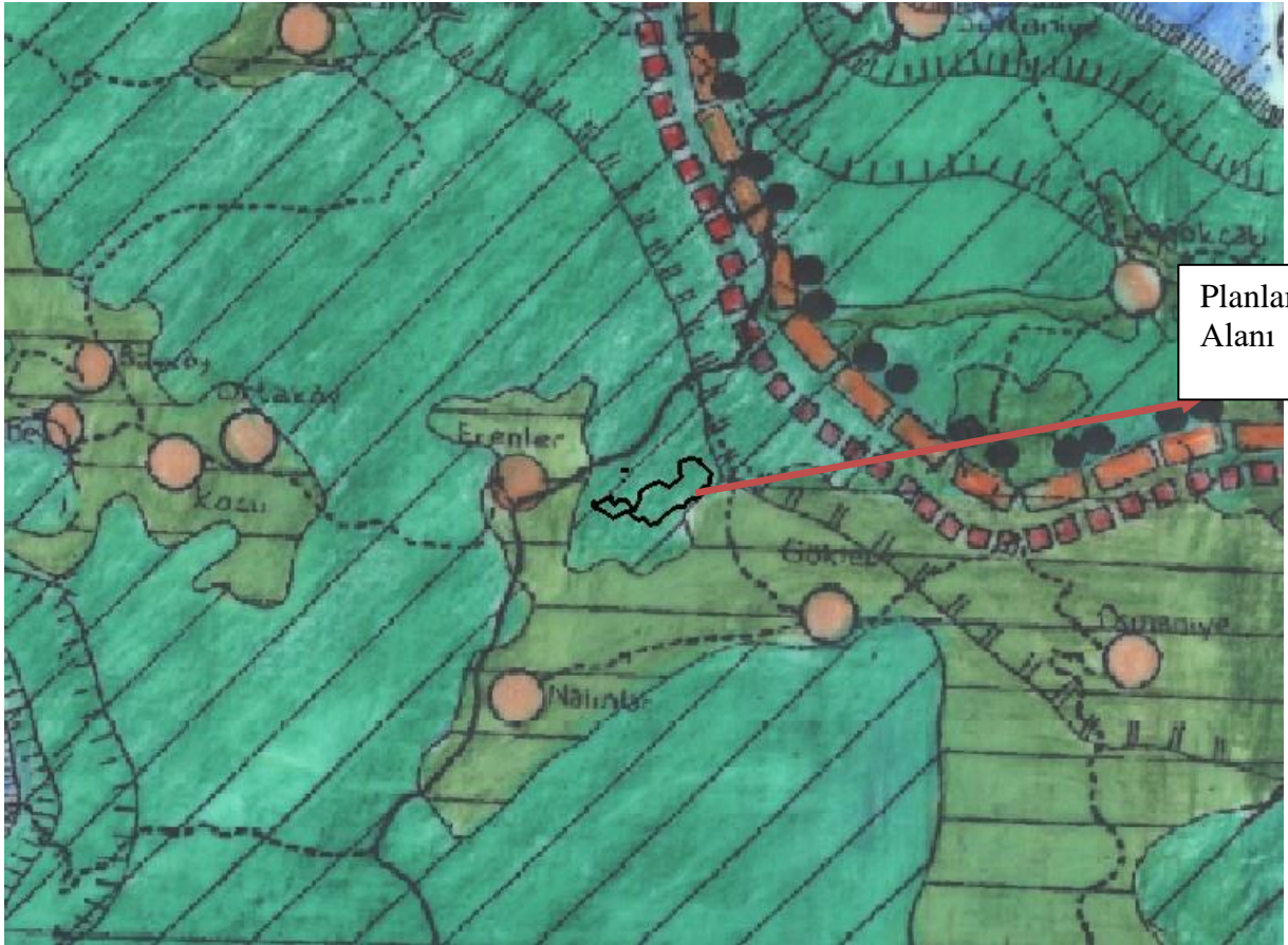
1/100000 Ölçekli Bursa Çevre Düzeni Planı

Planlama alanı; Bursa İli, Orhaneli İlçesi, Göktepe Mahallesi sınırları içinde olup; 1/100000 Ölçekli Bursa Çevre Düzeni Planında; Planlama Bölgeleri Dışında Orman Alanında kalmaktadır. Planlama Alanı yaklaşık 367154 m 2 'dir.